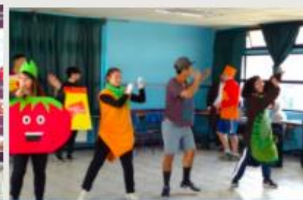
PEDAGOGÍA EN EDUCACIÓN FÍSICA