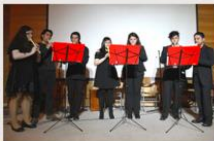
PEDAGOGÍA EN ARTES MUSICALES