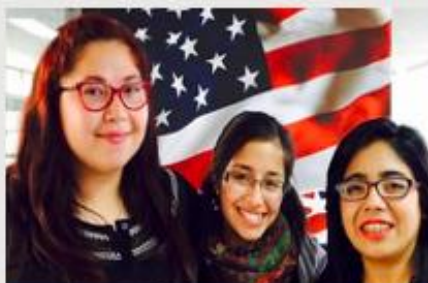
PEDAGOGÍA EN INGLÉS