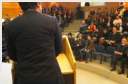
PEDAGOGÍA EN CASTELLANO Y COMUNICACIÓN