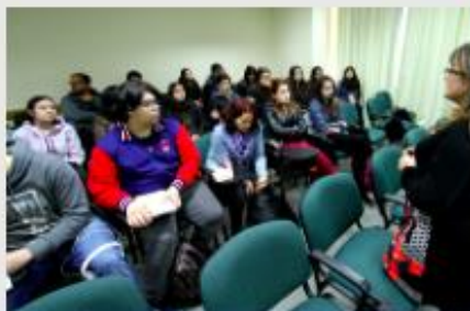
PEDAGOGÍA EN EDUCACIÓN BÁSICA