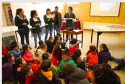
PEDAGOGÍA EN EDUCACIÓN PARVULARIA