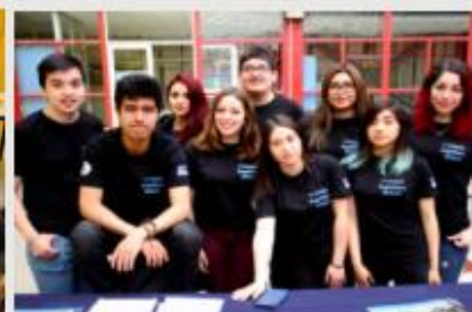
PEDAGOGÍA EN MATEMÁTICAS

Observatorio de Políticas Pedagógicas (OPEPP)