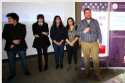
PEDAGOGÍA EN HISTORIA Y CS. SOCIALES