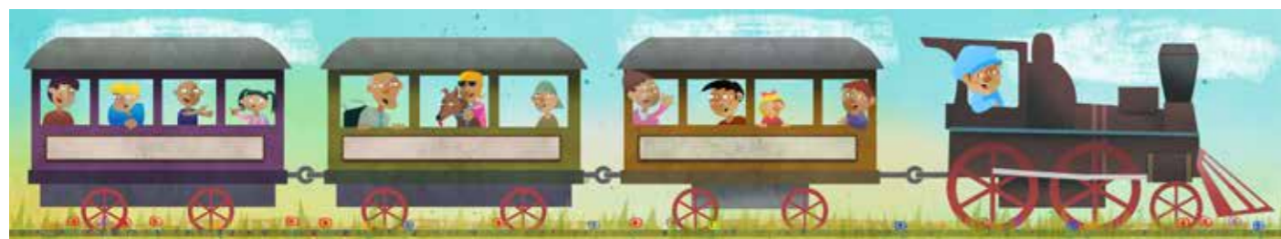
La accesibilidad es el medio, el soporte para el fin último que es la inclusión.

En Chile, en los últimos años se han realizado esfuerzos en distintos ámbitos para mejorar la calidad de los espacios públicos y de atención de público, y podemos observar avances sustanciales en: la implementación de oficinas de reclamos y sugerencias; la digitalización de la información sobre beneficios y programas sociales del Estado; la difusión de manuales sobre los programas sociales y guías sobre la atención oportuna al usuario.